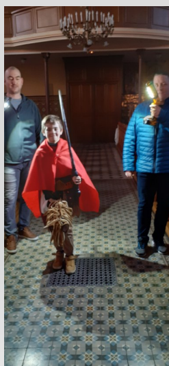
Saint Paul, incarné par un enfant qui rejoue les moments importants de sa vie