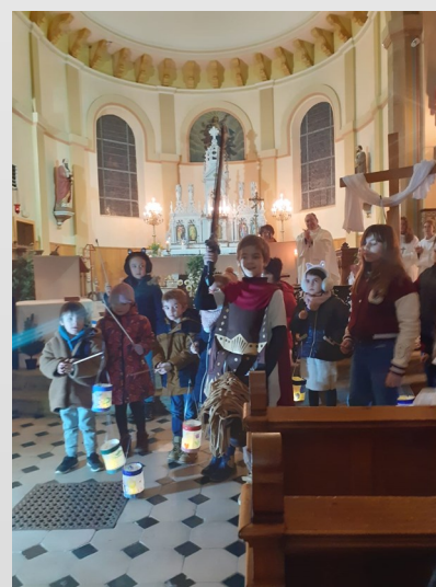
Arrivée dans l'église