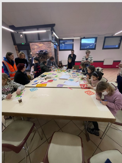
Confection des lanternes