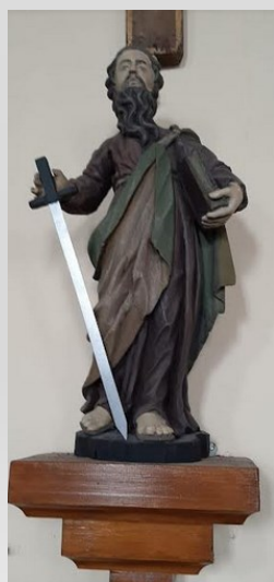
Statue de Saint Paul