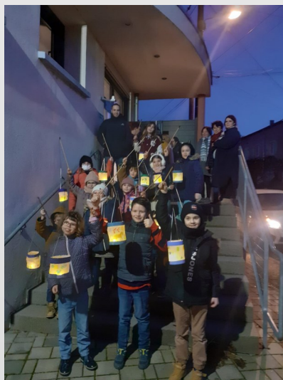
En direction de l'église, avec sa lanterne