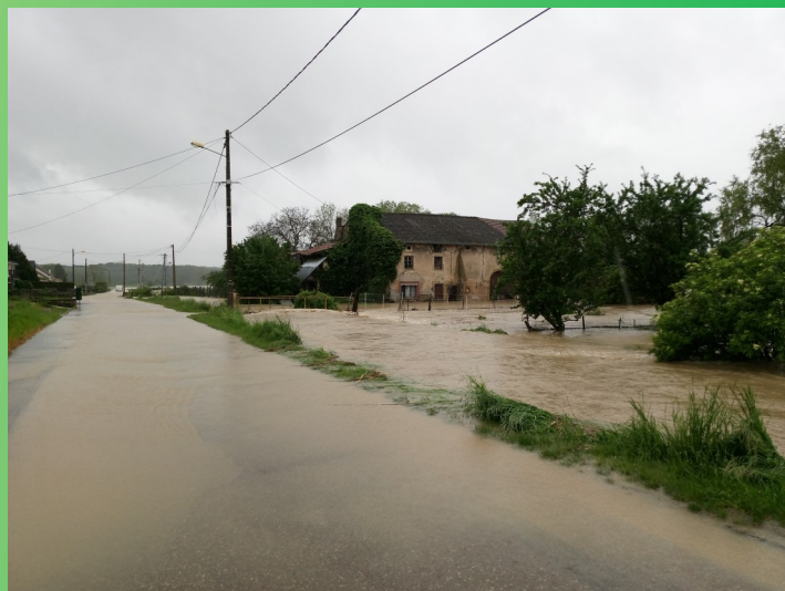
Sous l'eau, il y a la rue de la Forêt ! Le ruisseau a bien débordé, entraînant des inondations de caves et garages...